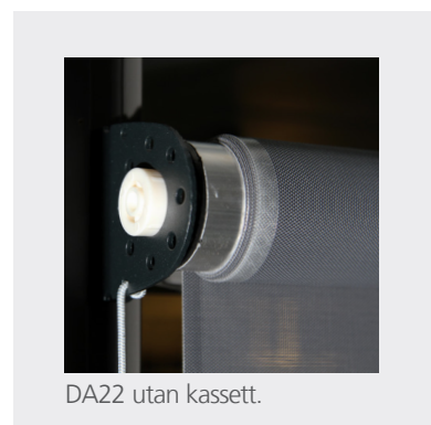
DA22 utan kassett.

Till DA22 finns det ett stort utbud av både markisväv och screenväv. Berøende på vävvalet kan markisen blockera upp till 90% av den instrålande värmen vilket kan hjälpa till att sänka energikostnader radikalt.