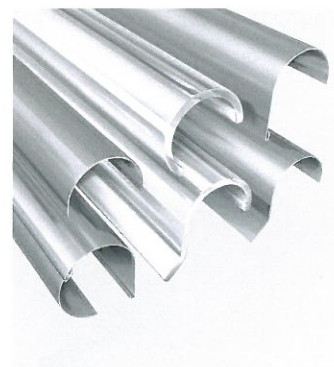
Mångfald av kassetter

Passande till den smarta tekniken ger det stora urvalet av tyger och färger tillräckligt spelrum för individuella anpassningar. De många panelerna och styrskenorna rundar av anpassningsförmågan hos WAREMA fasadmarkiser och markisoletter.